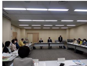
前林所長の提案で始まった団体等交流会も3年目になりました。