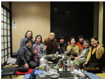
鉄板を囲んで温まりながら、近況報告をしました。