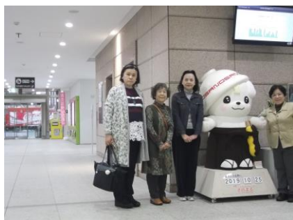
佐野市役所内で「さのまる」と記念撮影