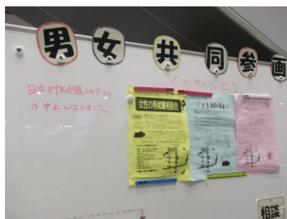
佐野市役所1F ホールの日本女性会議中止の告知

お昼前に佐野市役所に到着。台風 21 号が接近しており、傘も差せないぐらい暴風雨でした。