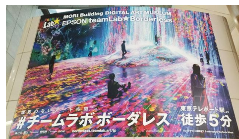
チームラボボーダレス