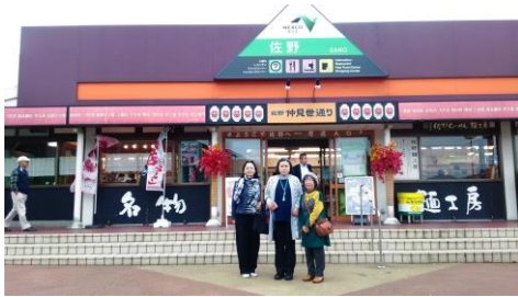
佐野サービスエリア

佐野サービスエリアでは、佐野ラーメンをいただきました。味は、徳島ラーメンに比べて、あっさりしていました。佐野SA付近は、大雨の被害はないようでした。