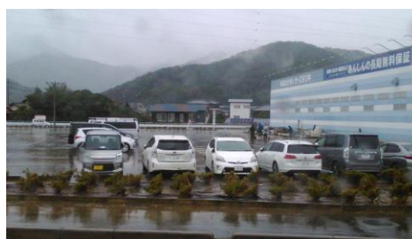
ケーズデンキ 泥かきのようす