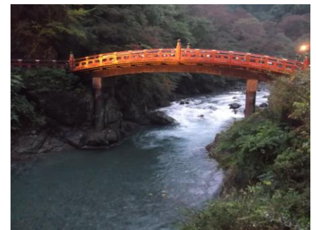
稲荷川のライトアップ