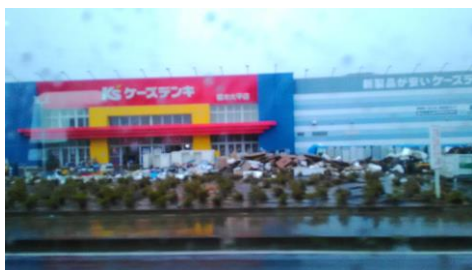
ケーズデンキ 被災ゴミの山