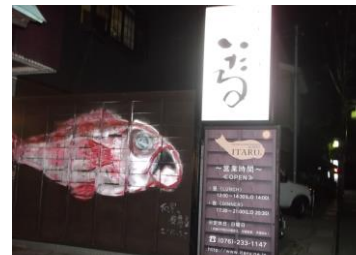
「いたる」本店で高級魚「のどぐろ」