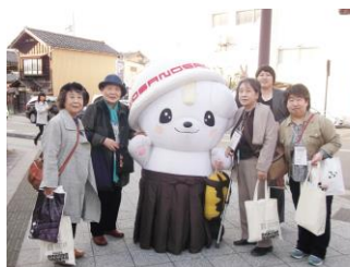
来年の開催地のゆるキャラ佐野丸がお見送り