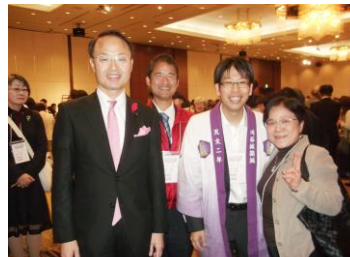
金沢市長と甲府市&刈谷市