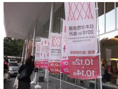
会場入り口ののぼり