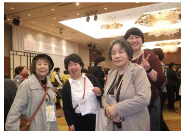
それぞれ盛り上がっています！