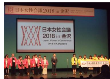
金沢市（左）から佐野市へ（右）