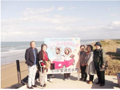
千里浜渚ドライブ