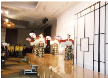
オープニングアトラクション

オープニングでは金沢市民謡協会の踊りが披露された。大会長、実行委員長の挨拶のあと、酒樽の鏡割りがあった。石川県は米どころで地酒がおいしいとのこと。今回のテーブルは、地域ごとではなく、分科会ごとだったので、分科会の続きの話をすることができてよかった。一般のお食事の他に、金沢の刺身、手まり寿司、金沢おでん、金沢カレー、加賀野菜てんぷらなどの郷土料理が提供された。人数の割に食事が少なかったように思う。毎回女性の食欲はすごい！阿南市女性協議会は日本女性会議 2015 阿南大会のTシャツを着て参加していたので、目立っていた。徳島出身という、いつも阿南大会はよかったと言ってくれるので、うれしい。次年度は栃木県刈谷市、その次は愛知県刈谷市、さらにその次は山梨県甲府市が開催地の予定。開催地がなかなか決まらない時もあったが、阿南市がやったことで、小さな町がやる気になっているとのこと。徳島効果は大きな影響を与えている。3年先の開催地までが来場して参加を呼びかけているのはすごいと思った。今年もスタヂを配ったら、喜ばれた。徳島のいい宣伝になった。お腹が減ったので、このあと、街歩きも兼ねて食事に出かけた。（笑）