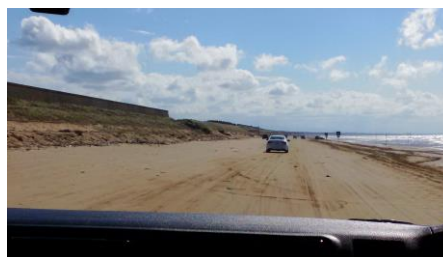
快適な8kmの渚ドライブ