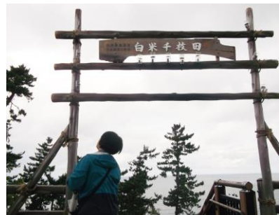
日本海をバックに 高校生が修学旅行の時に棚田の手入れをして千枚田が復活した。