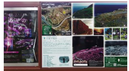
千枚田の写真パネル