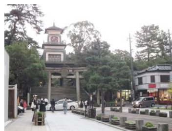
前田利家と正室お松の方を祀る尾山神社