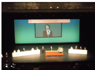
実行委員長の挨拶