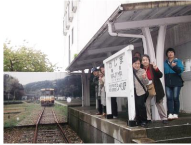
廃線になった終着駅のホーム 輪島⇄シベリア