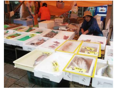
輪島の朝市（のどぐろが安い!）