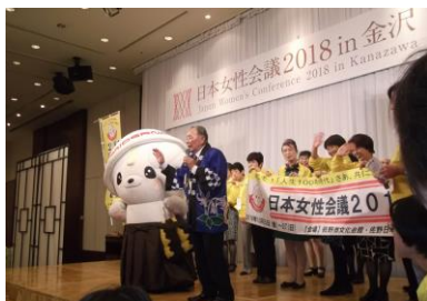
来年の開催地 栃木県佐野市