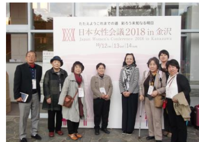
金沢歌劇座ホール入口